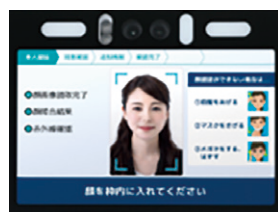
顔認証または パスワードの入力