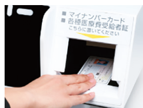
マイナンバーカード の読み取り